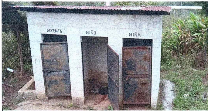
Foto 1: Sustitución o rehabilitación de letrinas ya que se encuentra en mal estado y esta en peligro de hundimiento